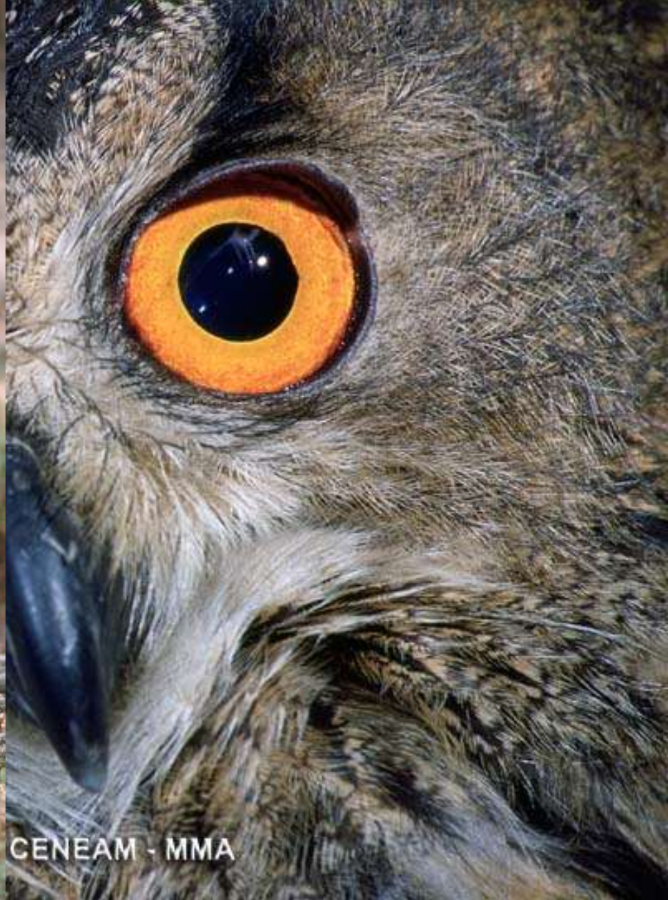
CENEAM - MMA

aves envenenadas en mediterráneas de la UE"