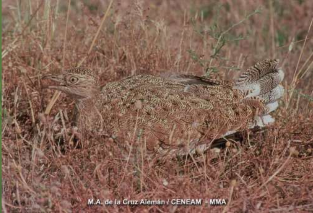
M.A. de la Cruz Alemán / CENEAM - MMA