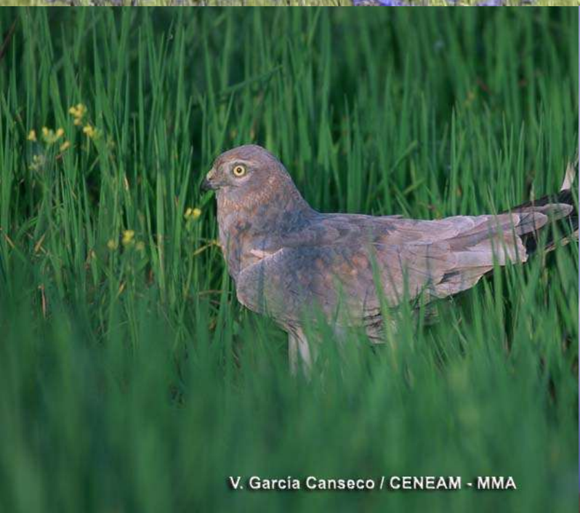
V. García Canseco / CENEAM - MMA